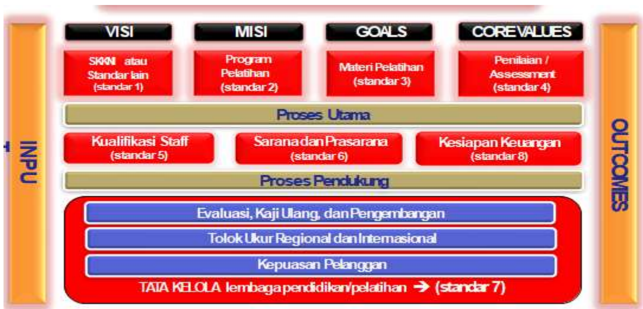
Gambar 2: Sistem Akreditasi LPK (Syaiful, 2017)

Proses akreditasi LPK sebagaimana telah dijabarkan diatas dapat digambarkan sebagai berikut ini merupakan sebuah sistem yang terdiri dari 8 (delapan) subsistem yang terangkai dan berhubungan erat antara satu subsistem dengan subsistem lainnya yang akan menjamin tercapainya tujuan akreditasi yaitu menciptakan LPK bermutu, untuk membentuk SDM Indonesia Unggul.